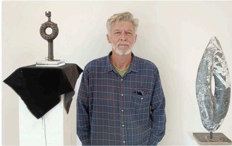
L'artiste Walter Reynaerts en exposition à la médiathèque.