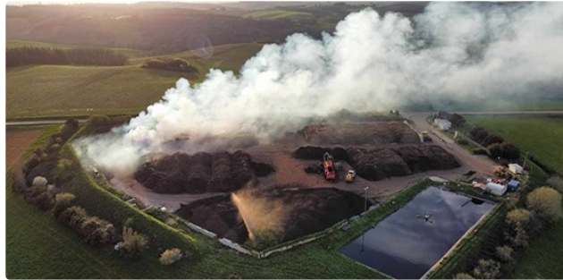
incendie sur le site de l'entreprise Lomagne Compost à Castéron