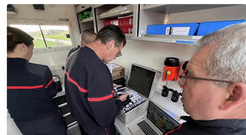
feu soufre 4.jpg