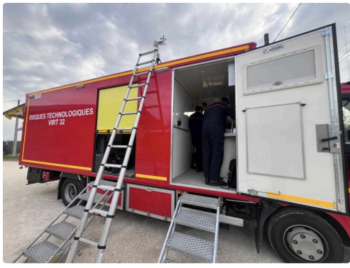
feu soufre 3.jpg