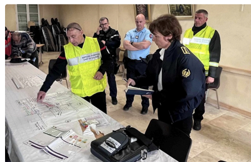
feu soufre 7.jpg

itinéraire des véhicules légers via D170, D27, Lamothe-Cumont puis Beaumont de Lomagne et D3 vers Lavit. Les poids-lourds doivent emprunter la déviation via D170 direction Mauroux, puis D13 et RD15 jusqu'à Montgaillard pour arriver à Lavit.