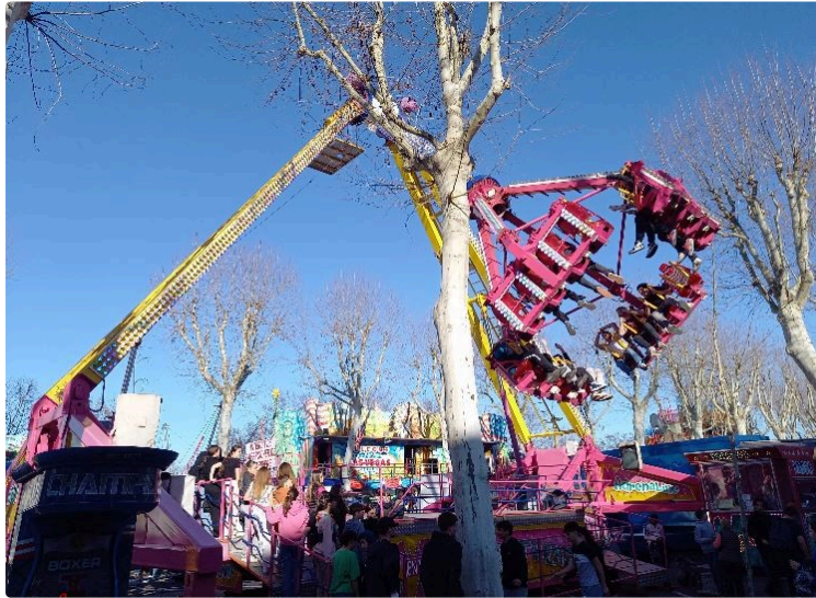
Plus que deux jours pour la fête foraine

Elle se conclue ce week-end du 16 au 17 mars