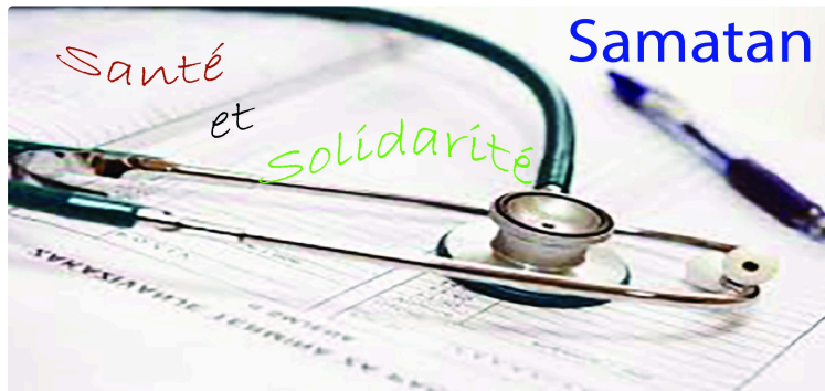
Une journée santé et solidarité demain samedi 23 à Samatan.

En ce mois de mars, la mairie de Samatan s'est volontiers investie pour permettre qu'une journée santé solidarité soit proposée aux habitants avec le soutien de nombreux partenaires.