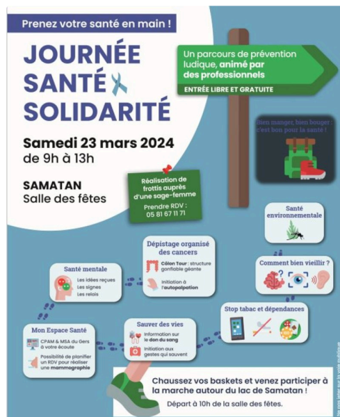
samatan sante 321.JPG