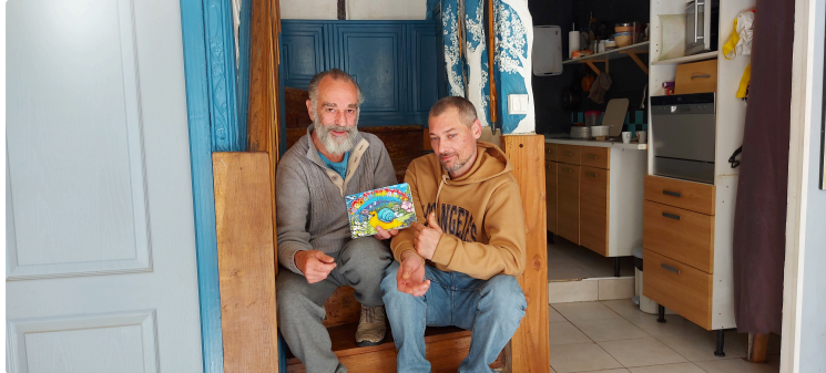
Avec le printemps, Croche Patte est de retour !