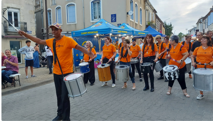
Africa Vic vous propose "Odyssée" pour voyager à travers les percussions du monde !

« Origines » l'an passé, « Odyssée » cette année, le festival annuel d'Africa Vic est de retour