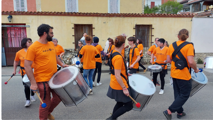
Le festival "Odyssée" d'Africa Vic sur DFM 930 mercredi !

Samedi 6 et dimanche 7 avril se déroulera le festival annuel de l'association Africa'Vic à Vic-Fezensac salle polyvalente.