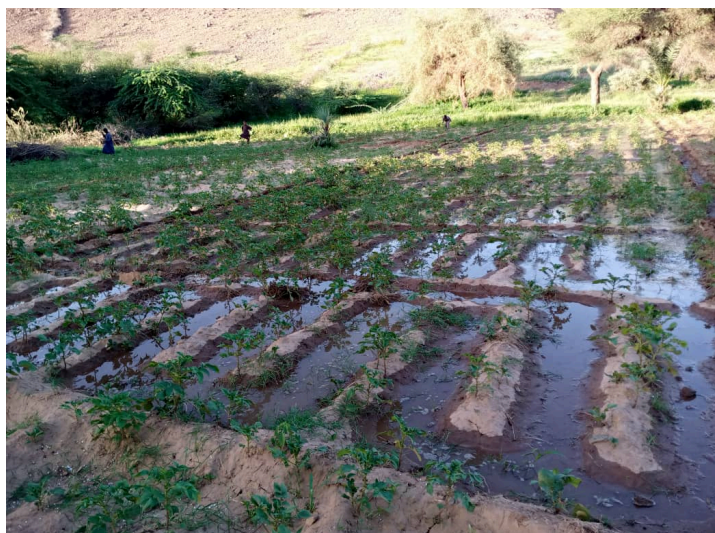
Espace maraîcher

des périmètres maraîchers féminins (les Dogons ont ainsi pris goût aux légumes),