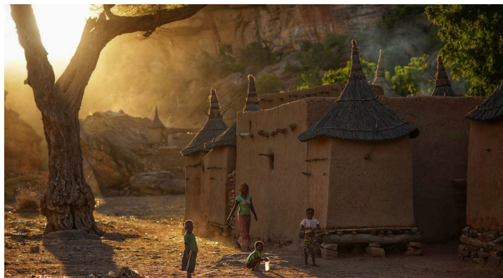
Village de Toyogu