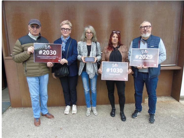
Quatre associations de Duran pour quatre projets au Budget Participatif Gersois