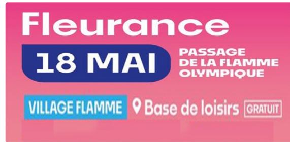
La Flamme Olympique moment de partage et d'unité

Samedi 18 mai 2024, la 10ème étape du relais de la Flamme Olympique aura lieu dans le Gers. Grâce à son investissement et sa labellisation « Terre de Jeux 2024 », la Ville de Fleurance a été retenue pour le passage de ce symbole olympique.