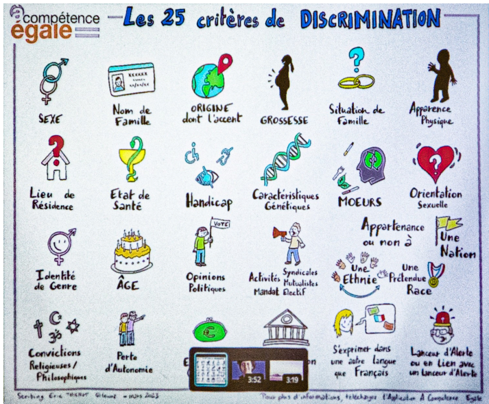
Liste des 25 critères de discrimination interdits par la loi, tels que projetés par Les Bascos

Ensuite, la liste des 25 critères de discrimination interdits par la loi est projetée et commentée.