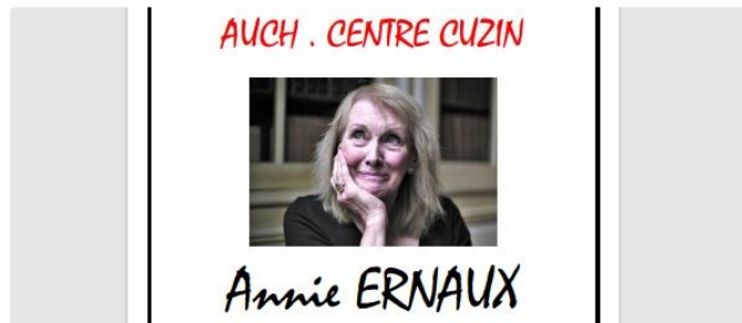
Le Griot Blanc propose la lecture de "La Place"

Une oeuvre, prix Renaudot, écrit par Annie Ernaux, première française prix Nobel de la littérature