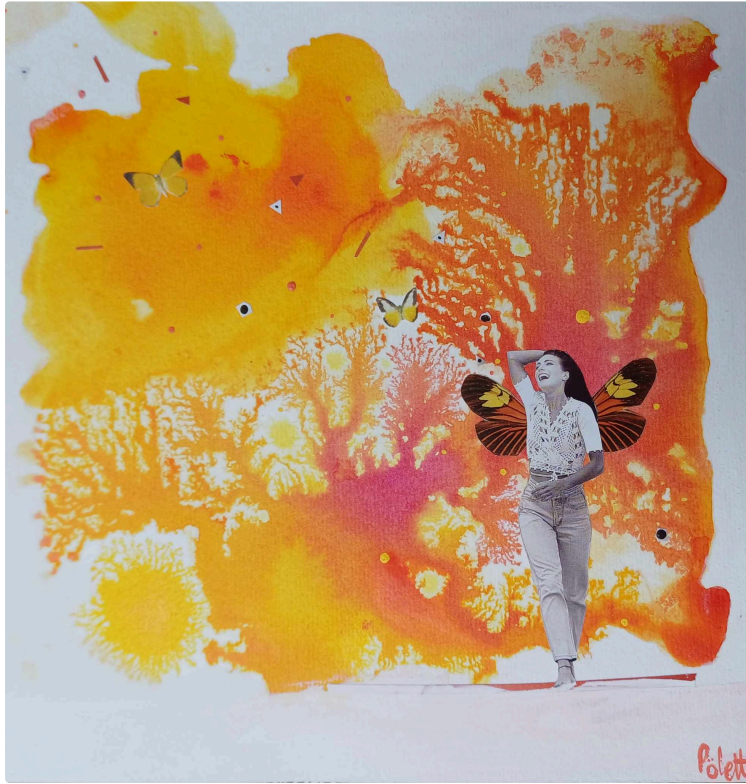
Exposition Délires, une exposition contre la morosité ambiante !

Pour lutter contre la morosité ambiante, venez rêver et sourire en dégustant les pépites d'humour noir et de rêve que vous propose l'exposition justement nommée "Délires"