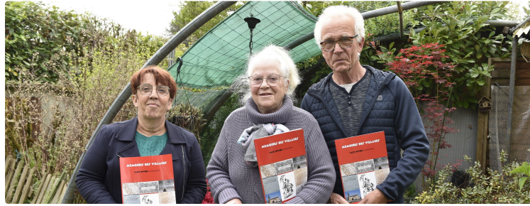
Mémoires des villages

L'ultime plaquette de Mémoires des villages sera disponible vendredi 19 avril à la médiathèque de Villecomtal sur Arros.