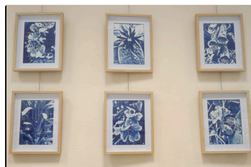
condom mediatheque bleu 1.JPG

A compter du 13 mai plongez dans le sport condomois de ces dernières décennies. Affiches et documents à l'appui découvrez deux siècles de sport dans la sous-préfecture.