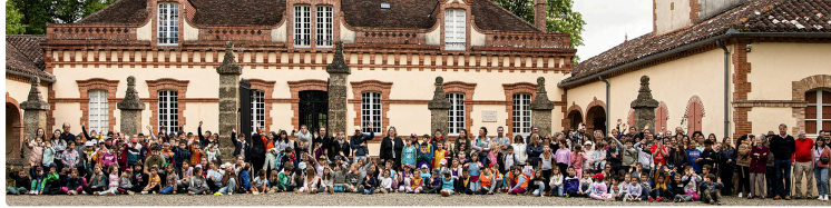
Perchède : Écofête junior au château de Pesquidoux

Thème : Transition écologique et alimentaire