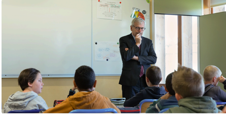
Présentation de la proposition de loi rédigée par les enfants de la classe CM2 dans le cadre Parlement des enfants, École de Riscle