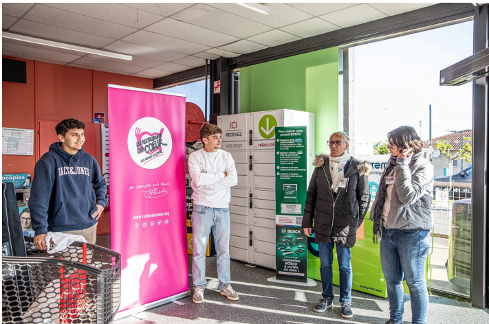
Collecte au supermarché Carrefour