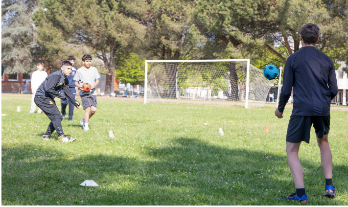
Phase d'une partie de ballon prisonnier