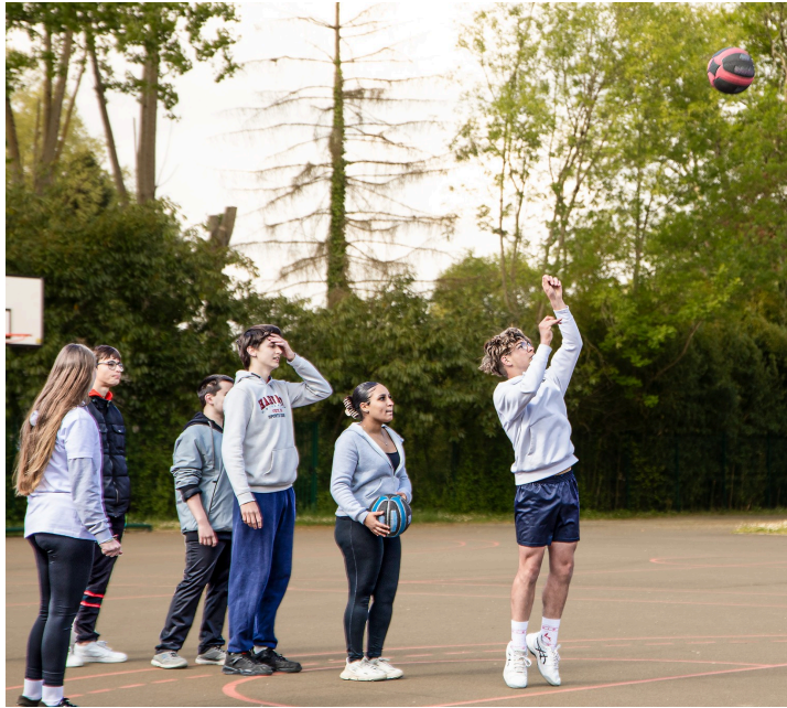
Lucky Luke basket