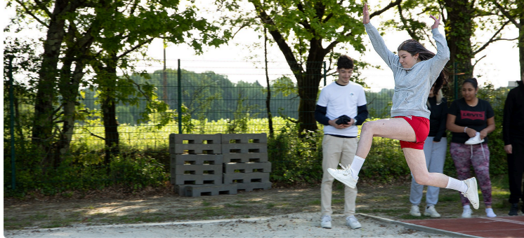
Olympiades du 23 avril 2024 : chef d'œuvre de la Terminale Commerce du lycée de Nogaro

4 épreuves sportives pour les secondes pro encadrées par la Terminale Commerce