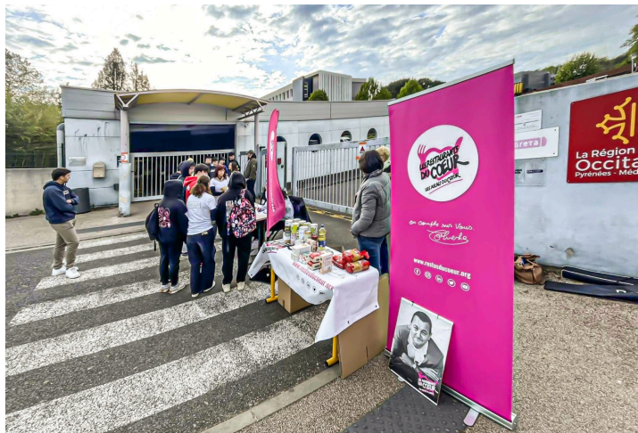
Collecte de denrées devant le lycée d'Artagnan

Comme on l'a peut-être lu dans l'article consacré à la préparation du chef d'œuvre de la Terminale Commerce de la Section pro du lycée d'Artagnan de Nogaro (1), ledit chef d'œuvre est un élément de la note finale au baccalauréat : il vise à promouvoir l'excellence professionnelle du jeune dans un but de valorisation de son parcours de formation auprès des futurs recruteurs.