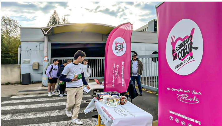
Collecte de denrées devant le lycée d'Artagnan

Mais ce chef d'œuvre-là ne comporte pas que des épreuves sportives. Il a aussi une dimension humanitaire : les élèves collectent des denrées pour Les Restos du cœur. Ces denrées sont récupérées par des bénévoles des Restos le matin du 23 avril devant le lycée (voir photo).