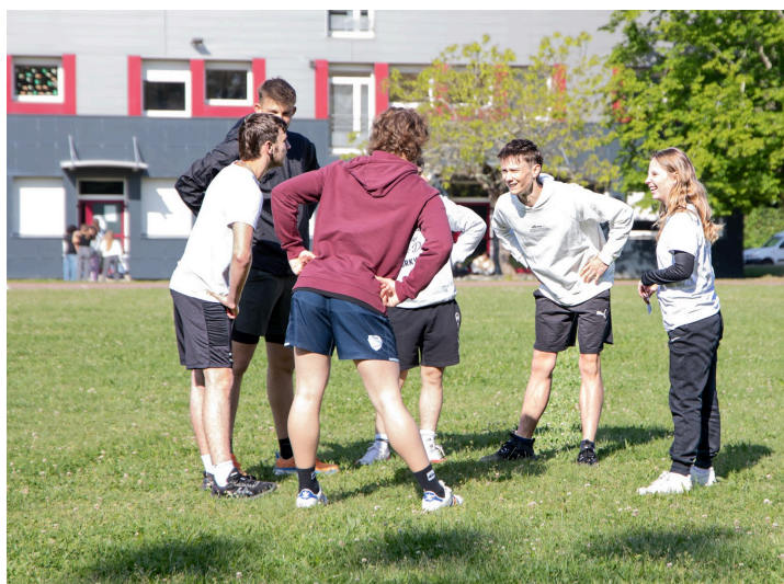
Un groupe s'échauffe avant le saut en longueur