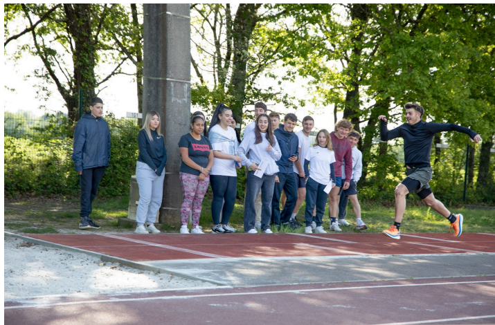
Le saut en longueur