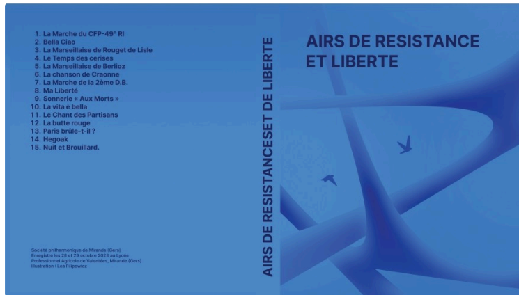
Une production musicale avec la Marche du Corps Franc Pomiès et autres titres de mémoire

Avec l'Association du Corps Franc Pomiès/49RI et la Société Philharmonique de Mirande