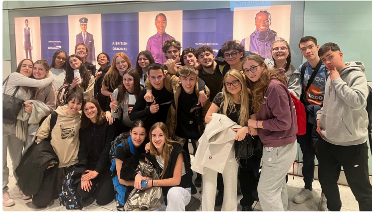
Lycée Oratoire : très grande réussite du séjour d'immersion aux États-Unis

24 élèves de classes de 1ère et de Terminale du lycée Oratoire ont vécu une expérience unique pendant 15 jours, dans l'état de Washington.