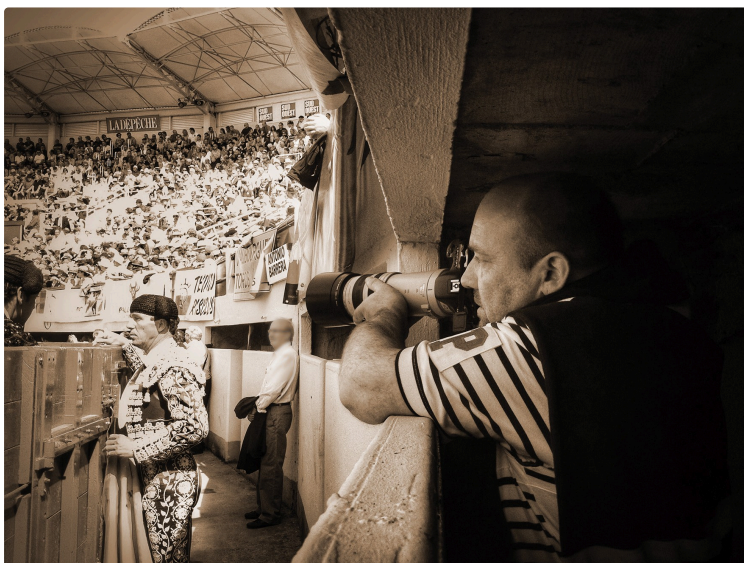
Circuit des arts Pentecôtavic 2024 : ELJO expose aux arènes « L'artauromachique »

Du 18 au 20 Mai 2024, Eljo vous dévoilera son exposition « L'artauromachique » d' une trentaine d'oeuvres , photographies et peintures dans la galerie des arènes de Joseph Fourniol à Vic-Fezensac durant tout le week-end de la fêria de Pentecôte.