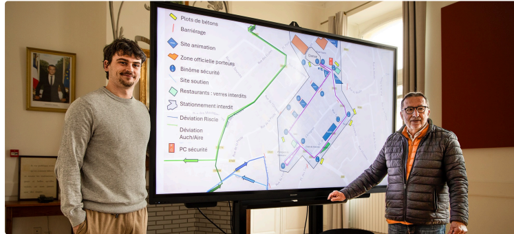
La Flamme Olympique passe à Nogaro dans un dispositif organisé et sécurisé (date rectifiée)

Les piétons sont les bienvenus, mais pas les voitures