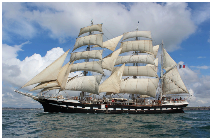
Le Belem

Les sapeurs-pompiers et les vétérans sapeurs-pompiers seront rue du Four (avec les Flammes!).