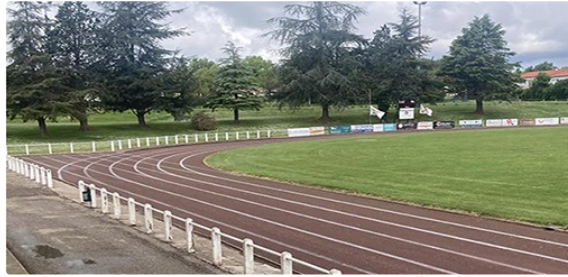
Une piste de champions

Il y a fort longtemps que la piste d'athlétisme du stade Jean Trillo n'avait connu pareille attention !