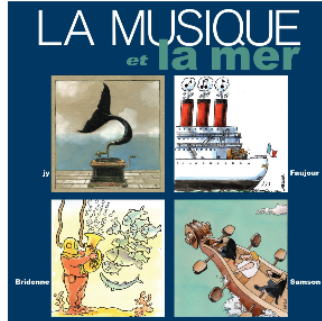
Circuit des Arts Pentecôtavic 2024 : "La musique et la mer", exposition à la bodega des Sept Péchés Capiteux

Dans le cadre du Circuit des Arts de Pentecôtavic 2024, Les Sept Péchés Capiteux, Professionnels de la Profession et Fo Feo Productions présentent