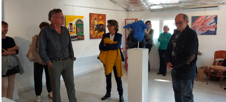
Circuit des Arts 2024 : les vernissages ont démarré !

Pentecôtevic, c'est aussi le Circuit des Arts qui permet pendant cinq jours de découvrir des oeuvres d'art dans tous les coins de la ville.