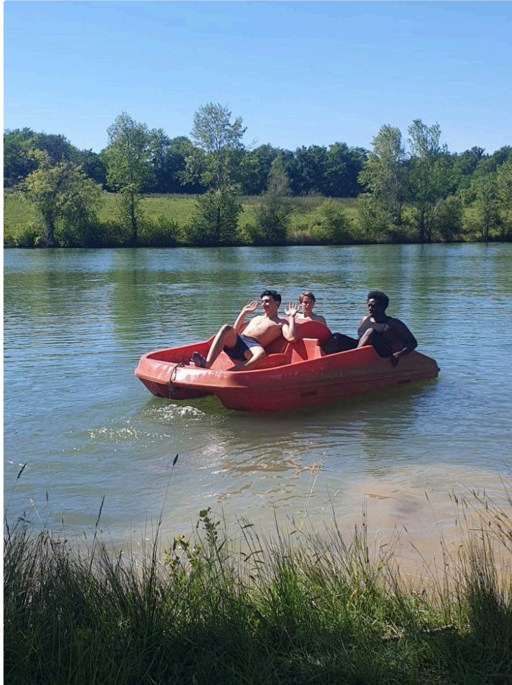
Deux jours à la ferme pour les internes permanents

La semaine du Campus La Salle St Christophe