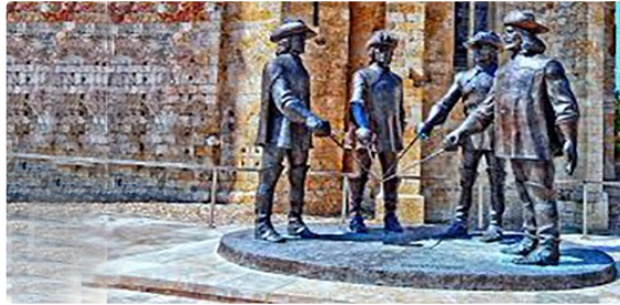
Restriction de circulation et de stationnement

Demain, samedi 18 mai 2024, la ville accueillera le relais de la flamme olympique.