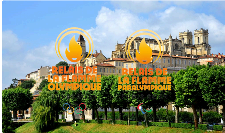
Auch a la flamme pour les jeux !

Après le tour du Gers pour la flamme, l'apothéose, c'est donc le tour d'Auch. Après un départ place de la cathédrale un peu avant l'heure prévue (vu sur l'article précédent) nous retrouvons la flamme Conseil Départemental avec peu de monde devant l'Hôtel départemental. En fait le public très nombreux se retrouve place de la cathédrale au départ et au parking du Mouzon pour l'arrivée.