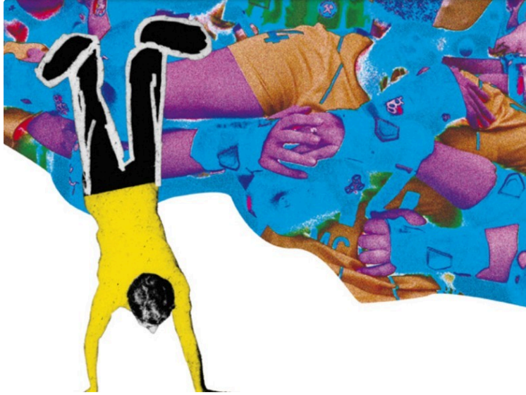
"La photo de classe " 5ème édition, au centre d'Art et de photographie de Lecture