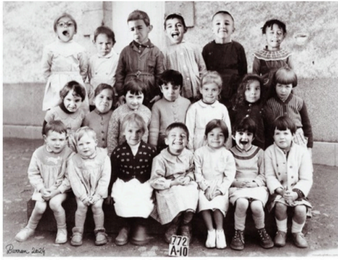
photo classe 2.jpg