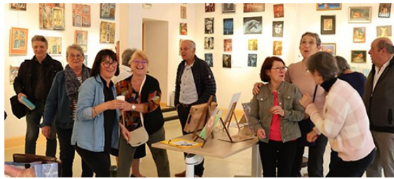
Tout est bon pour s'exprimer ... le café aussi