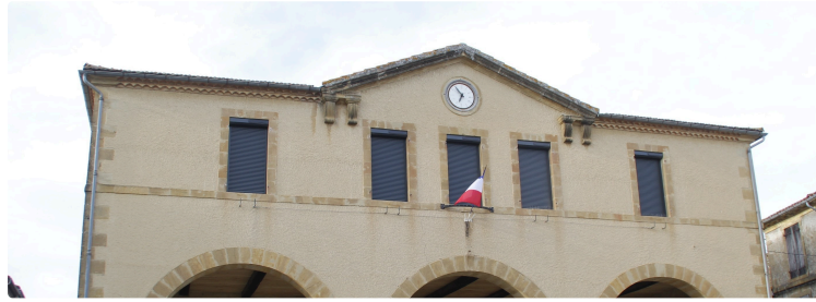
Mielan, réunion du conseil municipal