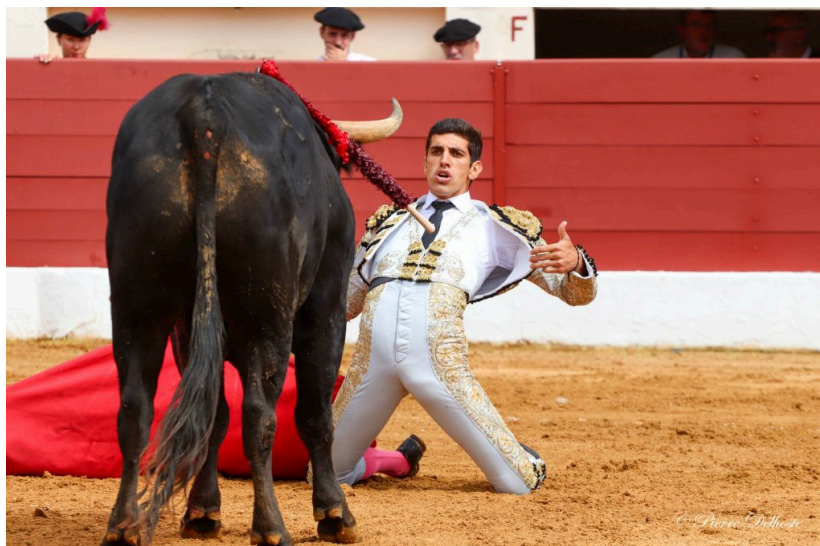
On constate que ces jeunes toreros ont du mal à franchir un cap et face à ces toros, ils n'ont peut-être pas la technique suffisante.