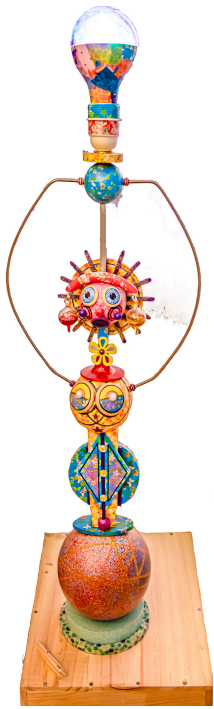
Une femme-lampe...qui éclaire