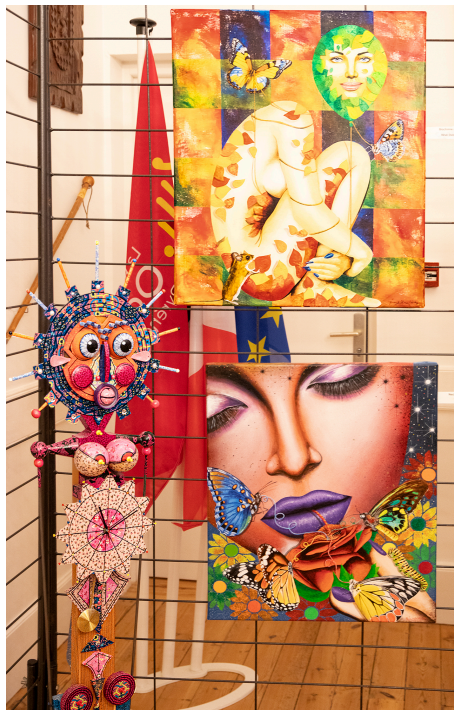
Sculpture et 2 tableaux