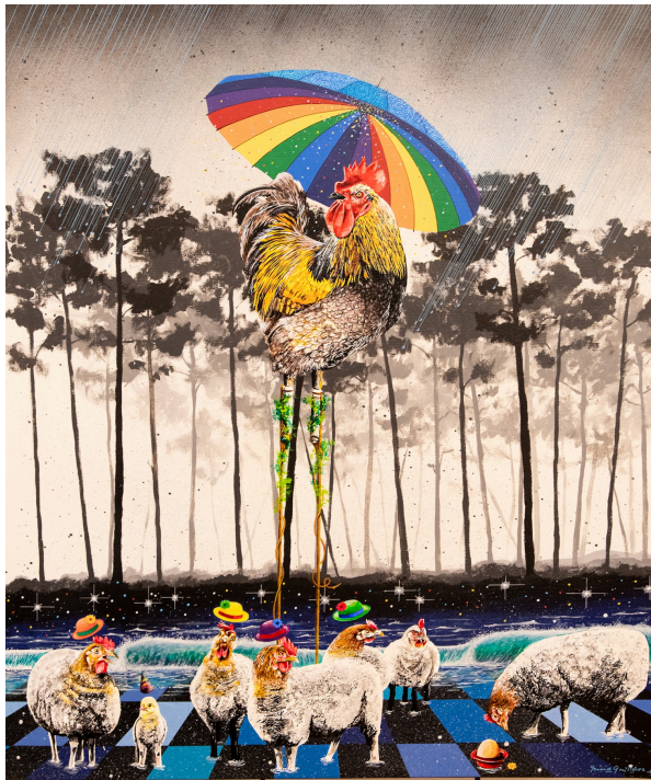
Le coq-roi règne sur des moutons à tête de poule...