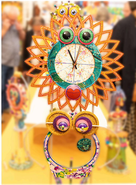
Une femme-pendule...qui marche