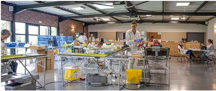
La salle est prête à recevoir les donneurs

La collecte de sang organisée par l'Établissement français du sang (EFS) et l'association Don du sang Nogaro Aignan (DSNA) le 27 mai 2024 est un succès : 89 personnes sont venues donner leur sang, dont 8 nouveaux donneurs.