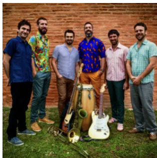
Le Tout Puissant Tropical Orchestra