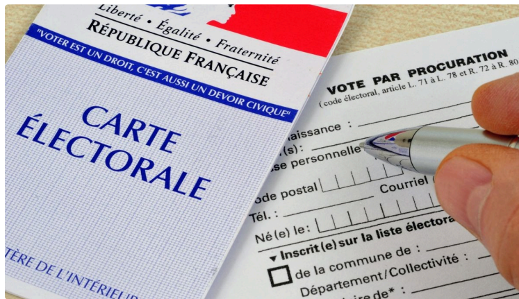
Le vote par procuration : des solutions pour tous les électeurs

À l'approche des élections législatives anticipées qui se dérouleront les 30 juin et 7 juillet prochains, le ministère de l'Intérieur et des Outre-mer renouvelle le dispositif de procuration entièrement dématérialisée déjà mis en œuvre lors des élections européennes de 2024.