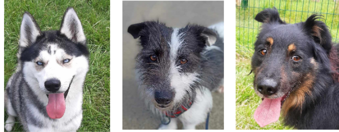
Les trois jeunes chiens de la semaine, Ulys, Mailou et Rex !

Cette semaine, la SPA vous présente trois loulous tous les trois arrivés au refuge en mai dernier.