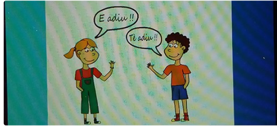
conférence du cercle gascon de négocis

Le cercle gascon de négocis organise une conférence sur la langue gasconne le 23 juin 2024 à 18heures, à Castera-Verduzan, salle de la mairie.