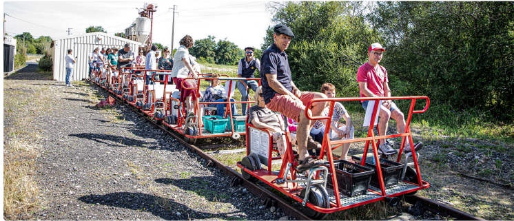
Nogaro : le Vélorail de l'Armagnac fête son 10e anniversaire

Une belle occasion de découvrir ses secrets, ses nouveautés et le projet de réhabilitation de la gare