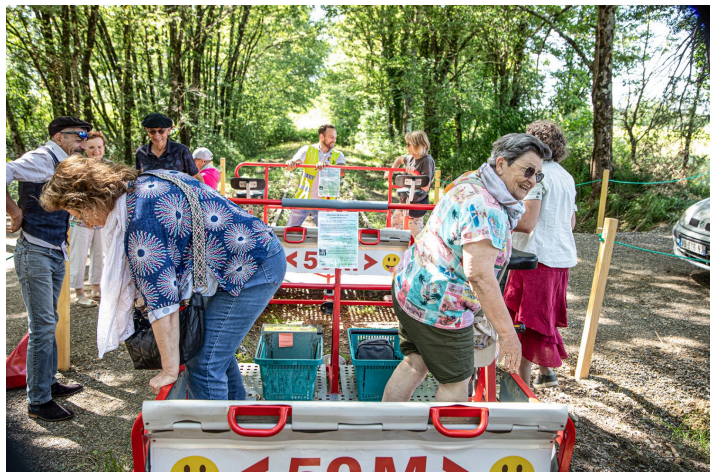
Arrivée au point de retournement