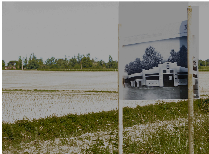
Photo de l'ancien chemin-de-fer