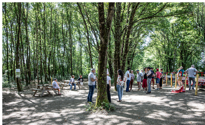
Le terre-plein de retournement est aménagé pour une halte agréable