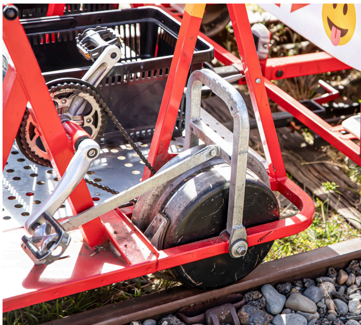
Système de freinage (ici sur le pédalier de droite)

en 2021, 5 nouvelles draisines ont été acquises (dont une en réserve).