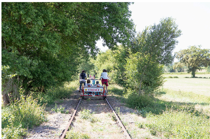
On approche du point de retournement