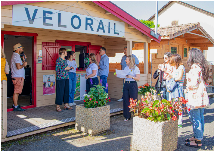
La gare du Vélorail le matin du 17 juin 2024

Le Vélorail de l'Armagnac a 10 ans ce 17 juin 2024 ! les autorités de la politique et du tourisme ont fêté cet anniversaire en prenant le Vélorail.