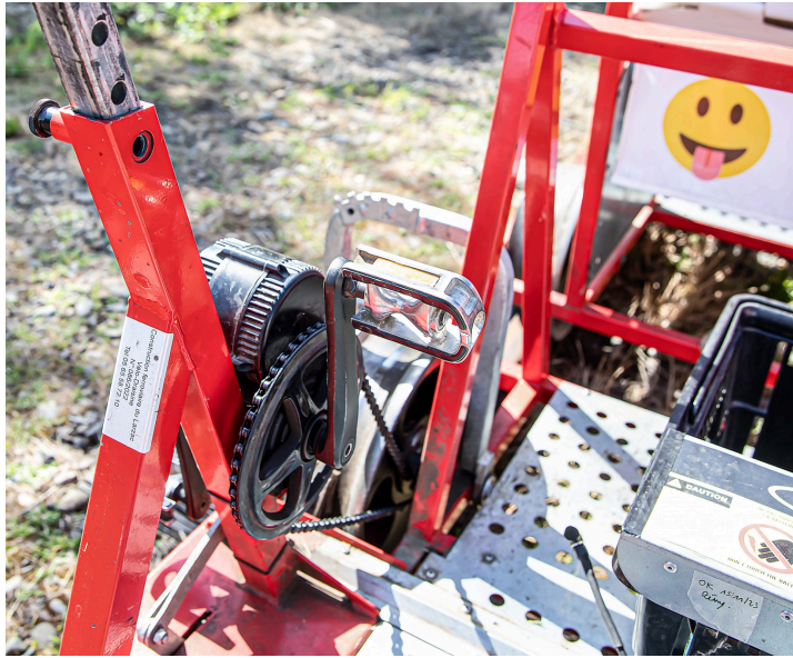
Assistance électrique sur le pédalier de gauche

en 2020, une assistance électrique a été ajoutée au pédalier de gauche sur chaque draisine,