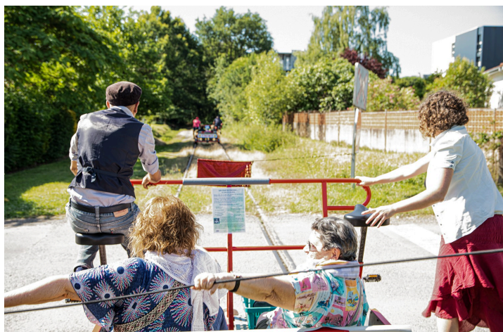
Passage à pied d'un carrefour avec une route