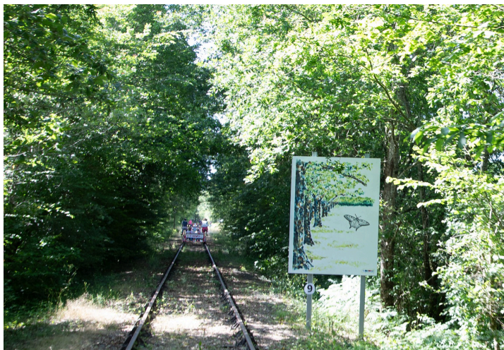
Autre aquarelle d'Emmanuelle Meffray