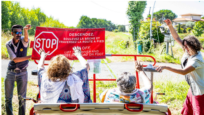
Traversée d'un autre carrefour