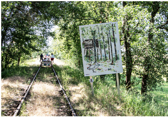
Une des aquarelles d'Emmanuelle Meffray