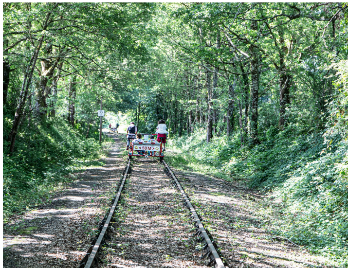
En plein bois

N.B. - Sur la photo du haut de page : les invités et les élus au départ.