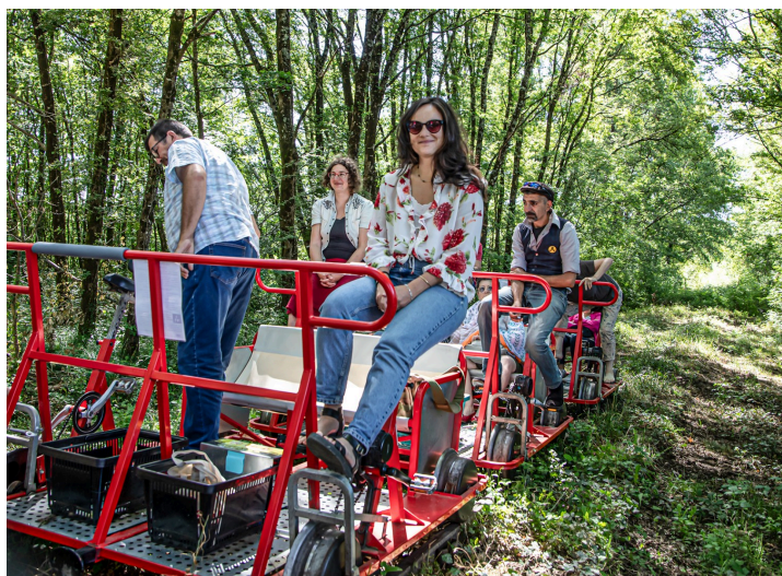
Deux autres équipages se préparent à repartir