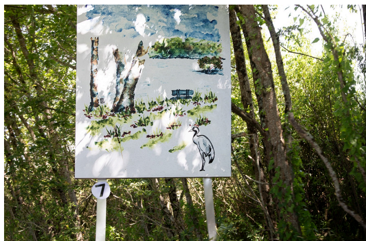
Nouvelle aquarelle d'Emmanuelle Meffray