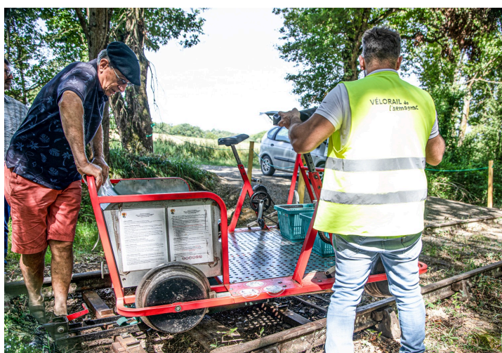
La draisine est prête à repartir en sens inverse