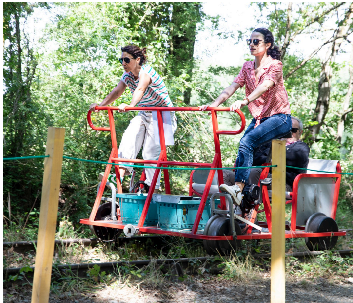
Une autre arrivée en douceur au terre-plein