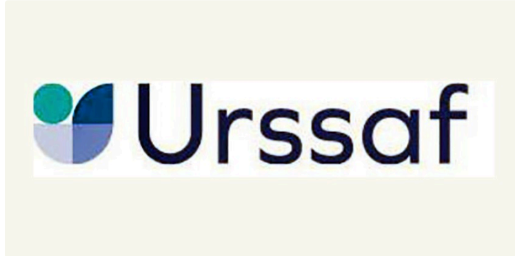
Emploi en Occitanie : accroissement significatif pour le 1er trimestre 2024