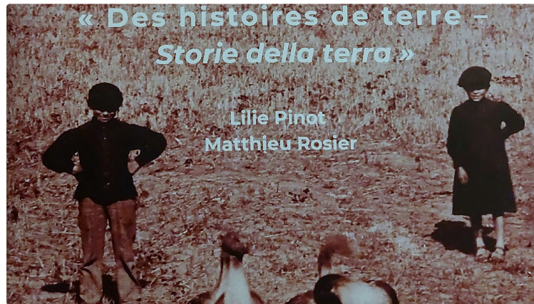
Exposition "Des histoires de terre- Storie della terra"