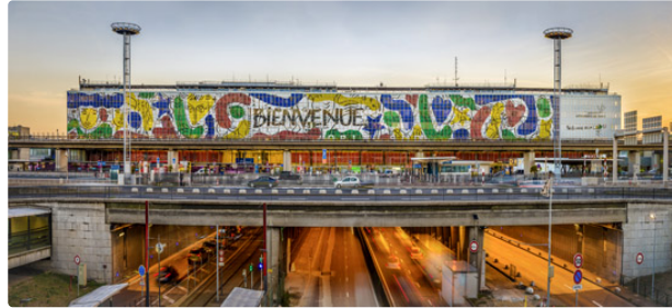
Jean-Charles de Castelbajac