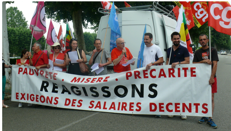
L'intersyndicale a manifesté surtout contre la réforme de l'assurance chômage et l'extrême droite

C'est une intersyndicale renforcée (CGT, UNSA, FO, Solidaires, CFDT, Confédération Paysanne, MODEF et FSU) qui a mené une manifestation ce jeudi 27 juin en matinée pour exprimer son opposition à la réforme de l'assurance chômage et son opposition à l'extrême droite. Ils étaient environ une centaine de personnes dans le cortège dont le départ a été donné devant le siège du patronat au 97 boulevard Sadi Carnot à Auch.