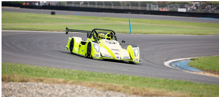
Funyo course 4 : gros plan sur Hervé Fouineau