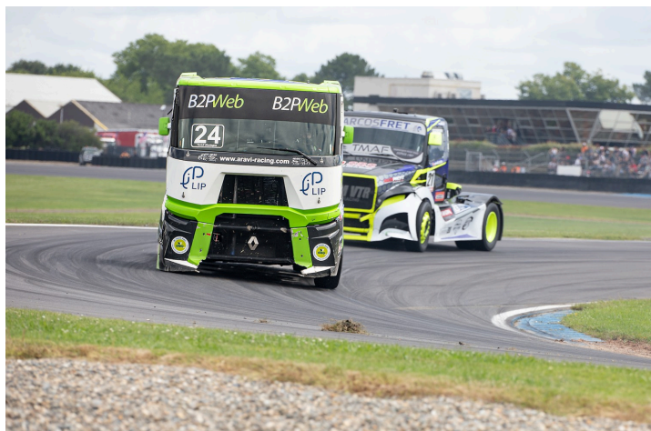
Course 3 : Yorick Montagne finit 4e