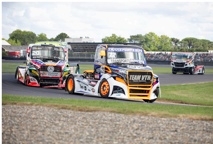
Course 4 : José Sousa devant Téo Calvet