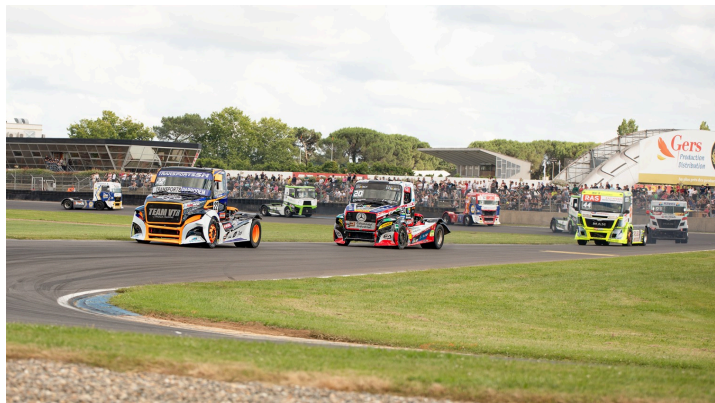
Course 4 : José Sousa devant Téo Calvet