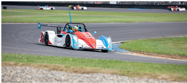
Funyo course 4 : gros plan sur Hugo Rouèche