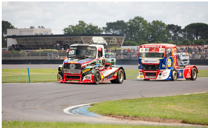
Course 3 : Téo Calvet reprend la 1e place devant Thomas Robineau