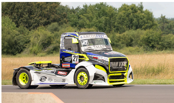
Course 3 : Raphaël Sousa (21)