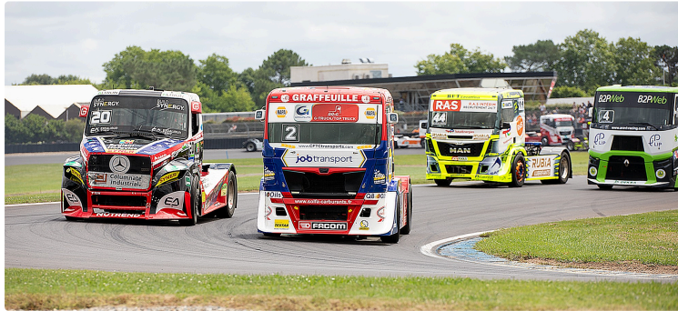
Nogaro : le Grand Prix Camion a attiré plus de 40 000 spectateurs

Téo Calvet toujours dans la tête de course