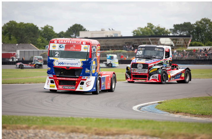
Course 3 : Téo Calvet (20) en 2e position derrière Lionel Montagne (2)