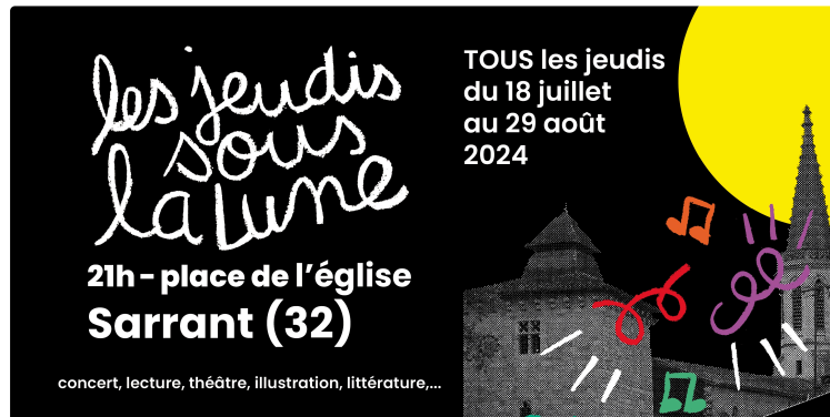
La Maison de l'illustration de Sarrant présente son programme estival.

Avec l'exposition "Oiseau, oiseaux", la Maison de l'illustration inaugure un nouveau cycle consacré au thème "Raconter la nature". Cette exposition unique explore la dualité de l'oiseau, à la fois en tant que symbole et en tant qu'habitant essentiel de notre planète.