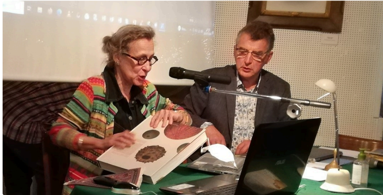
Réunion de la Société archéologique du Gers 3 juillet 2024