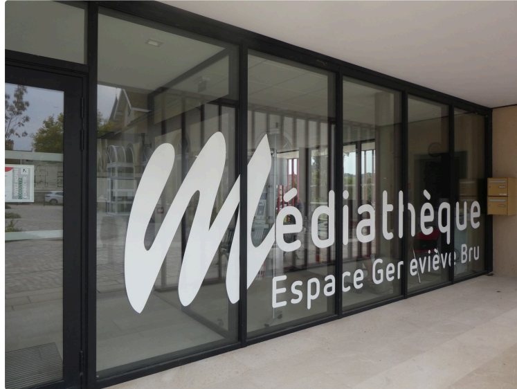
Les mois d'été à la Médiathèque