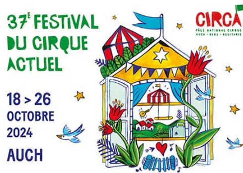
En avant première le programme du Festival

Voilà maintenant 37 ans que la capitale gersoise s'habille aux couleurs du cirque actuel chaque automne !