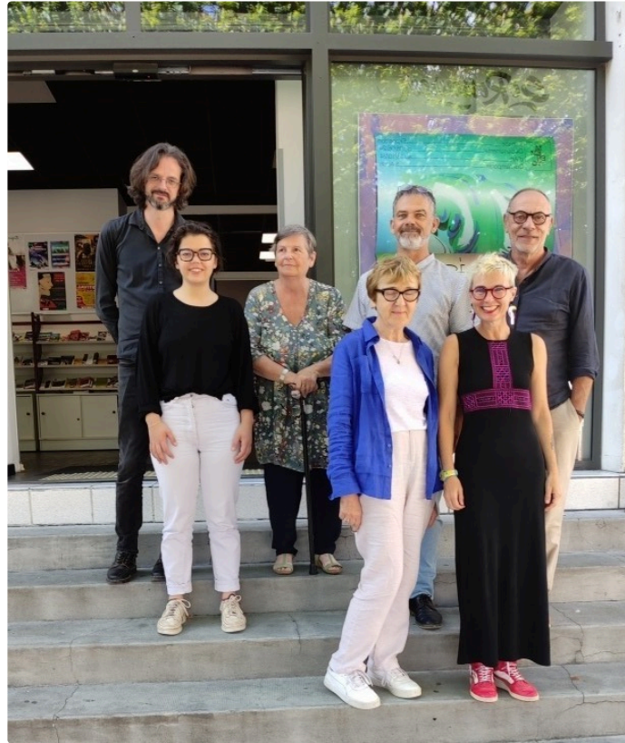
La conférence mensuelle de l'ADDA

Les festivals à venir et les appels à candidature de l'ADDA