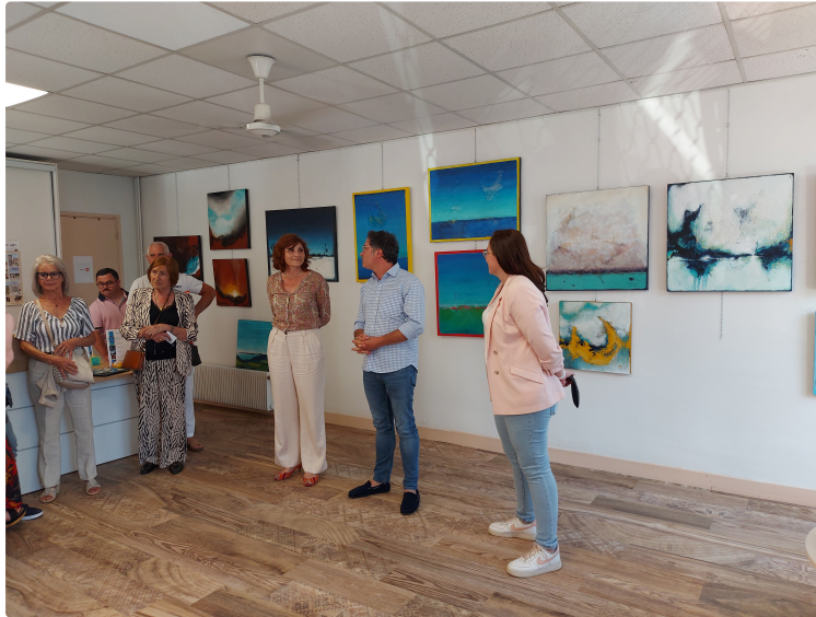
Zart-Zabelle expose à l'Office de Tourisme

Mercredi soir, en prélude au deuxième marché de nuit, avait lieu le vernissage de l'exposition des tableaux de Zart-Zabelle dans les bureaux vicois de l'Office de Tourisme Armagnac & d'Artagnan.